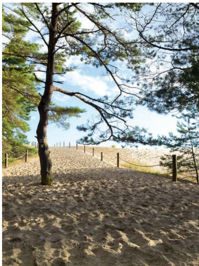
L'isthme de Courlande fascine avec l'une des plus grandes dunes de sable d'Europe.