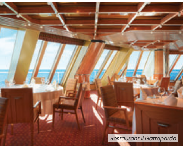
Restaurant Il Gattopardo

• Théâtre sur trois étages • Casino • Discothèque • Pont piscine avec verrière amovible et écran géant • Toboggan aquatique • Bibliothèque • Galerie marchande • Monde Virtuel • Espace Peppa Pig • Squok Club • Piscine enfants.