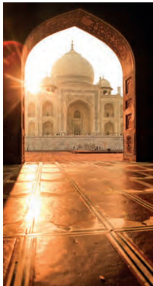
Taj Mahal Inde