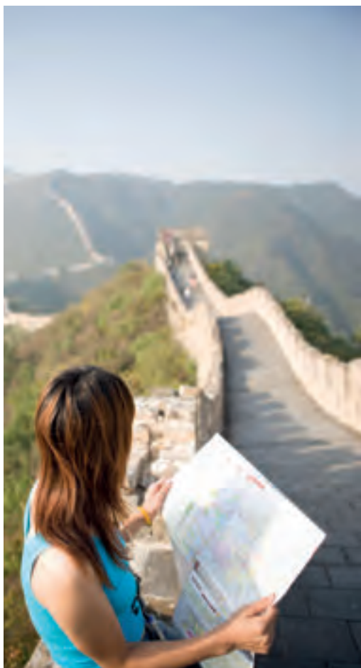
Grande Muraille Chine