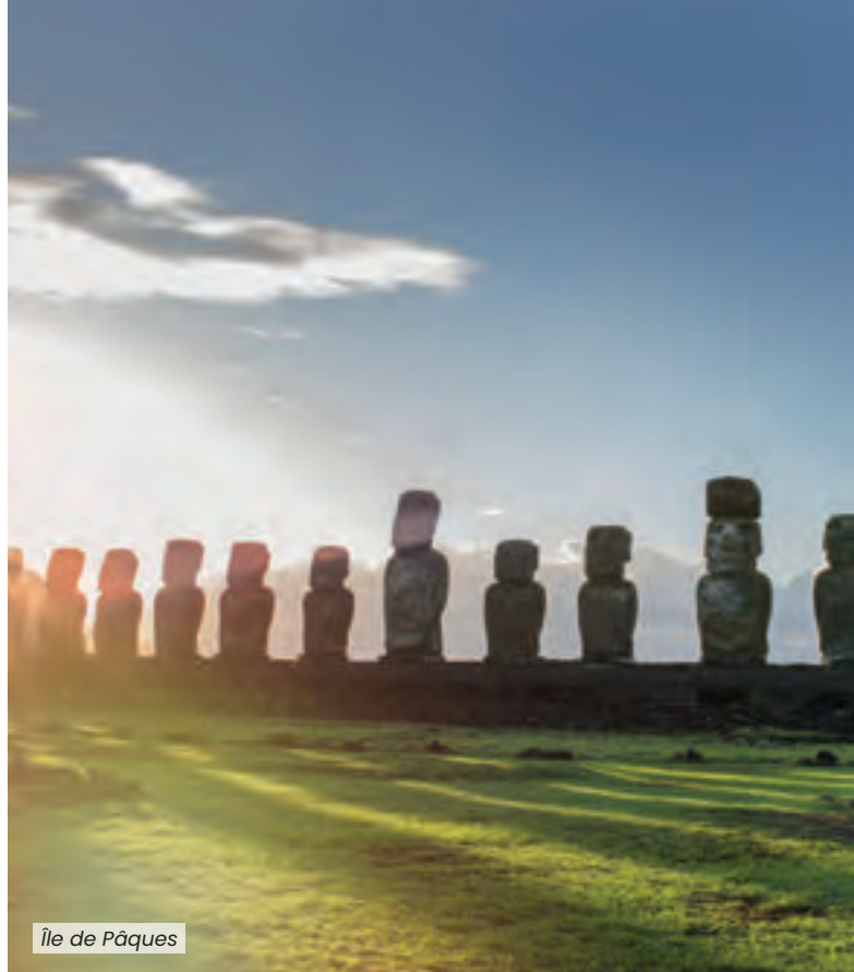
Île de Pâques

Nous organisons volontiers votre acheminement aller-retour, en autocar ou en avion.