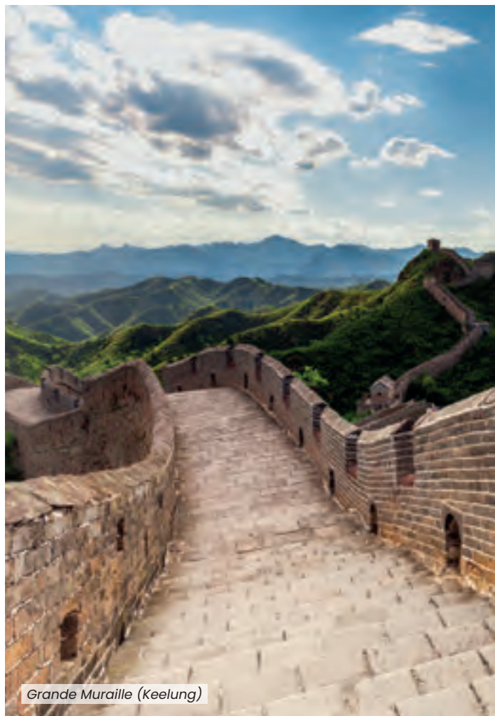
Grande Muraille (Keelung)