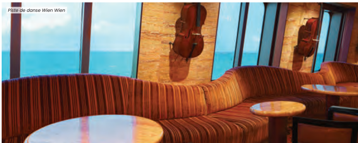
Piste de danse Wien Wien