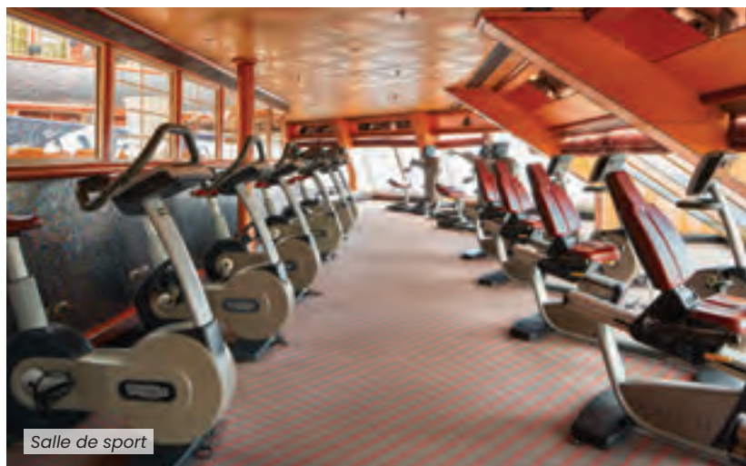
Salle de sport