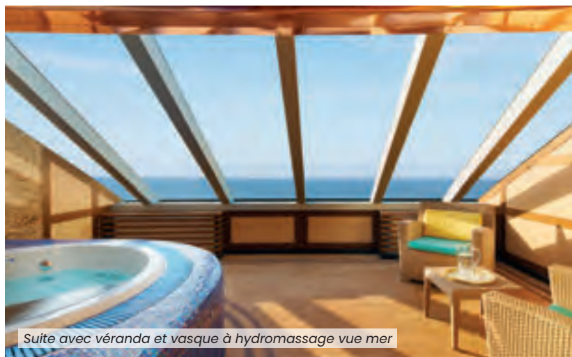
Suite avec véranda et vasque à hydromassage vue mer