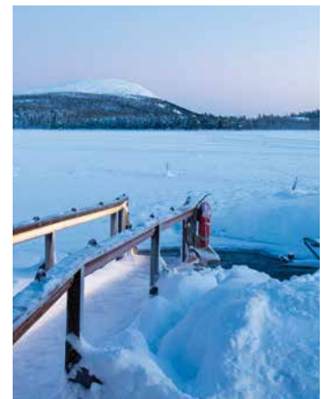
Le sauna avec baignade dans l'eau glacée - un des points forts du voyage.

03.02-10.02.2024 Chambre double/ Dortoirs 2580.- Chambre individuelle/ Dortoirs 2920.- 17.02-24.02.2024 (Semaine femmes) Chambre double/ Dortoirs 2580.- Chambre individuelle/ Dortoirs 2920.- 24.02-03.03.2024 Chambre double/ Dortoirs 2450.- Chambre individuelle/ Dortoirs 2790.- Code de réservation : wingruakt