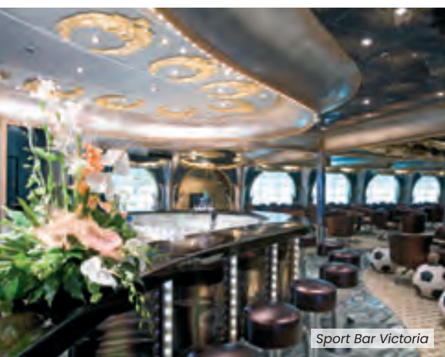
Sport Bar Victoria

• Théâtre sur trois étages • Casino • Discothèque • Pont piscine avec verrière amovible et écran géant • Toboggan aquatique • Point Internet • Bibliothèque • Galerie marchande • Monde Virtuel • Squok Club • Piscine enfants.