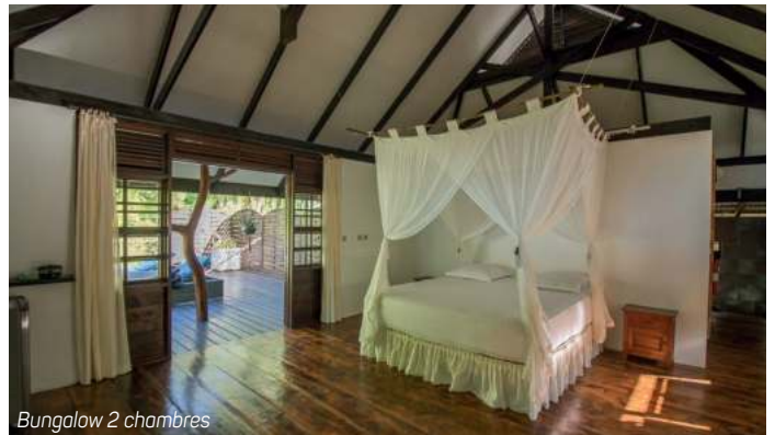
Bungalow 2 chambres