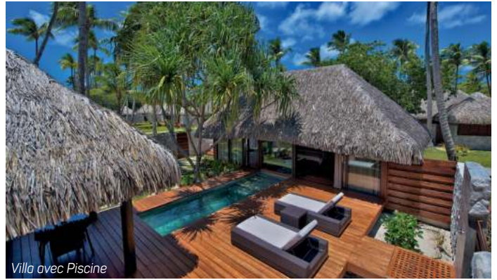
Villa avec Piscine